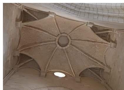
CROISEE DU TRANSEPT

L'église Saint-Pierre de Soubise est mentionnée dès le XII e siècle sur le capitulaire qui précise que la construction date de la même période que l'édification du château de Soubise (impulsion de l'Évêque de Saintes – Pierre II de Soubise) comme collégiale romane desservie par un prieur et des chanoines, à proximité immédiate de l'ancien château des seigneurs de Soubise. Elle est édifiée durant la période de la réforme Grégorienne, et occupe une position stratégique dans le paysage de la vallée de la Charente.