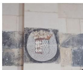
PARTIE DE LA LITRE FUNERAIRE DES ROHAN, SOURCE : PLATEFORME OUVERT DU PATRIMOINE

Entre le début du XVIII e siècle et 1712, la campagne de reconstruction est initiée, et financée en grande partie par Hercule Mériadec de Rohan, Prince de Soubise.