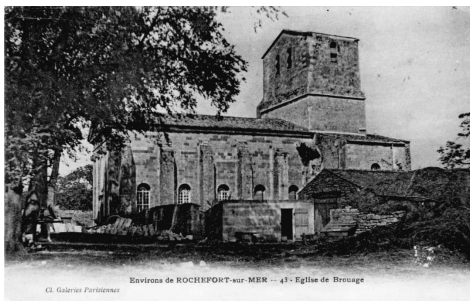
CARTE POSTALE DE L'ÉGLISE SAINT-PIERRE, SOUBISE

Le clocher de l'église Saint-Pierre, massif et visible de loin, a longtemps servi de repère pour la navigation fluviale de la Charente. Surmonté d'un bonnet révolutionnaire à la fin du XVIIIe siècle, il fait l'objet, après la Révolution, pendant la restauration, d'un arrêté imposant l'enlèvement de cet ornement.