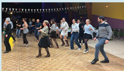
Soubise infos n°17